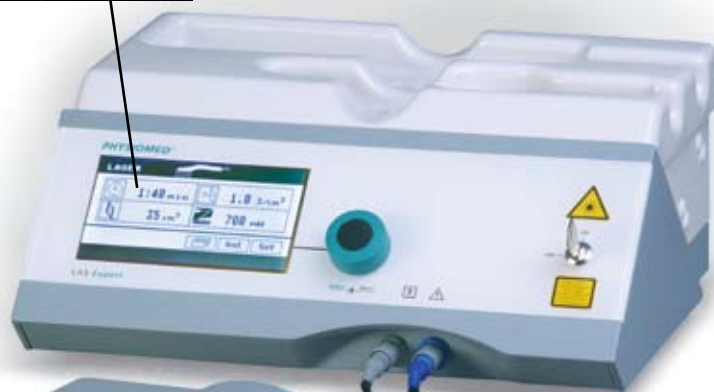
Laser tip duș