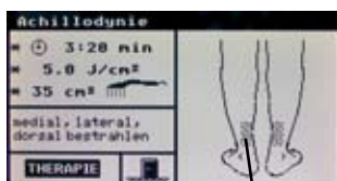
Propuneri de tratament cu imagini